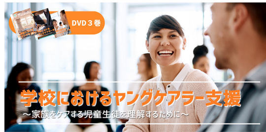
▶学校におけるヤングケアラー支援研修DVD