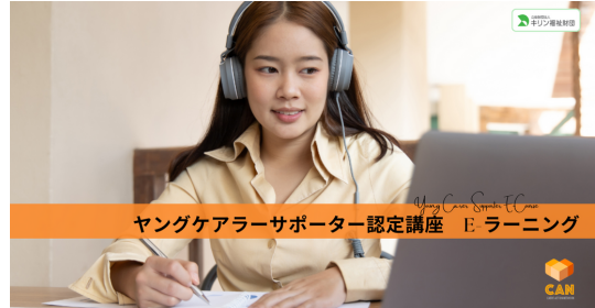
▶ヤングケアラーサポーター認定講座 E-Learning