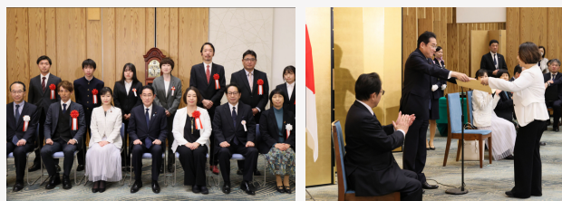
令和5年11月27日、首相官邸にて 初代 未来をつくる こどもまんなかアワード 内閣総理大臣表彰「応援団」部門授与

ヤングケアラーシンポジウム (NHKハートネットTV放映) /厚生労働省主催ヤングケアラーについて理解を深めるシンポジウム/学校におけるヤングケアラーへの対応と支援について考えるフォーラム/子どもの未来アクションフォーラム/こどもみらいフォーラムおおさか